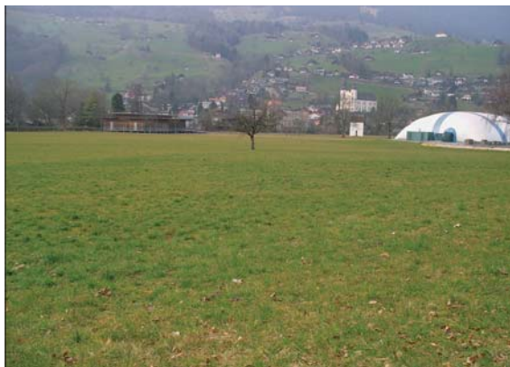
Im Gebiet Seefeld sollen weitere öffentliche Anlagen entstehen.

Im Frühjahr 2009 soll über die neue Ortsplanrevision von Sarnen abgestimmt werden. Damit dies möglich wird, müssen Gemeindepräsident Werner Stauffer, die Planungskommission, die Abteilung Planung und das spezialisierte Planungsbüro noch viele Arbeitsstunden leisten. Eine Orts- und Raumplanungsrevision muss gemäss Raumplanungsgesetz alle 15 Jahre erfolgen. Die Sicherung von Bauland für die kommenden 15 Jahre ist für eine gesunde und nachhaltige Entwicklung von Sarnen wichtig. Das Gesetz schreibt vor, dass mit den vorhandenen Ressourcen haushälterisch umzugehen ist und bestehende Baulandreserven zu nutzen sind, bevor neue geschaffen werden können. Hier liegt das Problem: In der Einwohnergemeinde Sarnen sind zur Zeit 28 Hektaren Bauland eingezont. Ein Grossteil davon ist weder käuflich noch bestehen konkrete Projekte zu dessen Nutzung. Rund 70 Einzonungsgesuche sind hängig. Solange