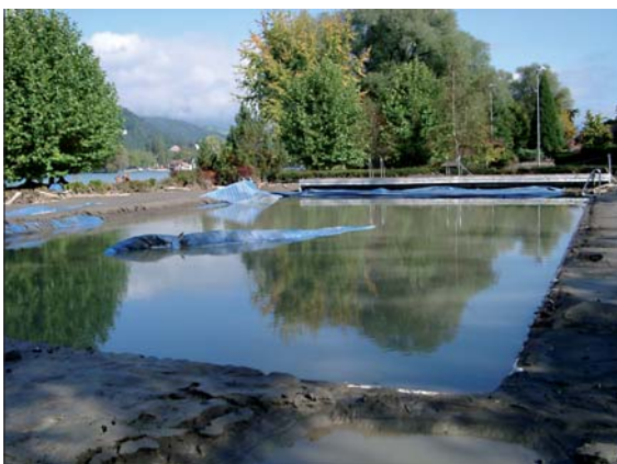
Das Jahrhundert-Hochwasser von 2005 hat die Finanzplanung der Einwohnergemeinde Sarnen komplett über den Haufen geworfen. Die Folgen des Hochwassers werden diese auch in den kommenden vier Jahren erheblich beeinflussen.

Als Rückschau kann man das Zusammentragen der Zahlen für die Rechnung 2007 bezeichnen. Diese Arbeit fällt schwergewichtig im ersten Halbjahr an. Sobald die Rechnung abgeschlossen ist, wird sie von der Geschäfts- und Rechnungsprüfungskommission (GRPK) auf ihre Ordnungsmässigkeit geprüft, bevor sie im Mai der Gemeindeversammlung zur Genehmigung vorgelegt wird. Bereits im Juni beginnt die Planung für das kommende Jahr: Die verschiedenen Verwaltungsabteilungen sind aufgerufen, ihr Budget für 2009 einzureichen. In Einzelgesprächen klären ich und der Abteilungsleiter Finanzen mit jedem Abteilungsleiter und dem zuständigen Gemeinderat das vorgelegte Budget, damit sich Ein- und Ausgaben und die Investitionen möglichst die Waage halten. Endgültig ausdiskutiert und entschieden wird aber der Voranschlag anschliessend durch den Gesamtgemeinderat. Das Ergebnis wird Ihnen im November an der Einwohnergemeindeversammlung zur Genehmigung vorgelegt.