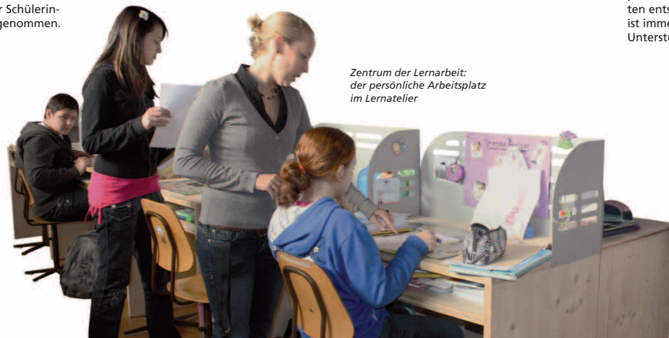
Zentrum der Lernarbeit: der persönliche Arbeitsplatz im Lernatelier

Alle Jugendlichen erhalten im sogenannten Lernatelier einen eigenen Arbeitsplatz und auch die Zeit, um die Inhalte und Aufgaben zu bearbeiten.