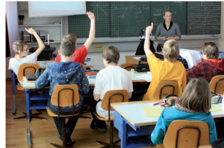
Unterricht als Inputveranstaltung

Die Ausführungsbestimmungen über das Beurteilen, die Promotion, der Wechsel des Niveaufaches und das Übertrittsverfahren in der Volksschule vom 11. Januar 2005 kommen weiterhin zum Tragen. Der Wechsel in andere Orientierungsschulen sowie ein Übertritt in weiterführende Schulen oder Berufsschulen ist somit gewährleistet.