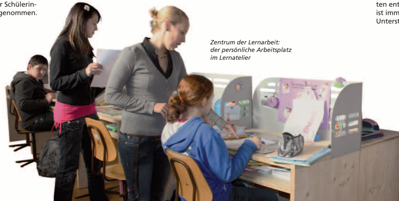
Zentrum der Lernarbeit: der persönliche Arbeitsplatz im Lernatelier

Alle Jugendlichen erhalten im sogenannten Lernatelier einen eigenen Arbeitsplatz und auch die Zeit, um die Inhalte und Aufgaben zu bearbeiten.