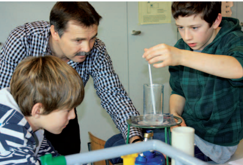
Coach bei der Arbeit mit Jugendlichen

Die Real- und Sekundarschule werden zur «Integrierten Orientierungsschule» zusammgeführt und die Schülerinnen und Schüler in niveaugemischte Stammklassen eingeteilt. In den Fächern Mathematik, Deutsch, Englisch und Französisch werden Leistungskurse in den Niveaus A und B angeboten. Für die Fächer Geschichte, Geographie und Naturlehre gelten einheitliche Niveaus. Den Schülerinnen und Schülern steht für die eigenständige Lernarbeit das Lernatelier mit einem eigenen Arbeitsplatz zur Verfügung.