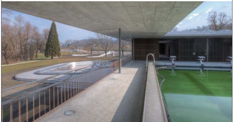
Vielseitiger Badespass: Panoramabad, Erlebnisbecken, Wasserrutsche

kann man in Ruhe seine Längen schwimmen und zugleich die Aussicht auf See und Berge geniessen – überwältigend!