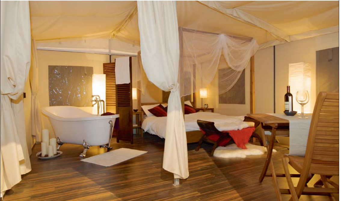
Glamour + Camping = «Glamping»: Innenansicht eines Suiten-Zelts