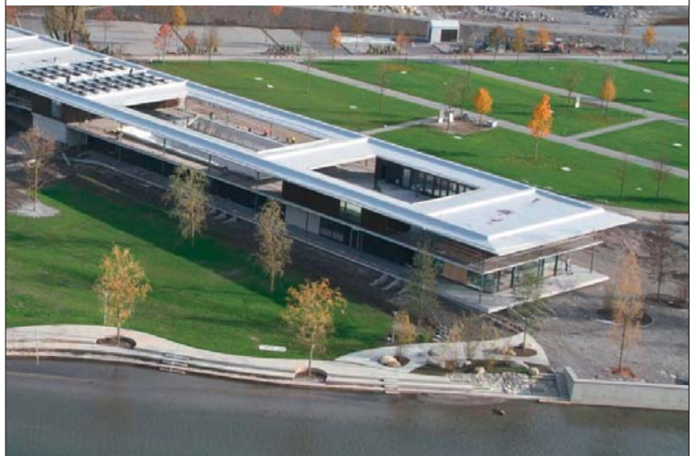
Futuristisch: das Herzstück des Seefeld Park aus der Vogelperspektive