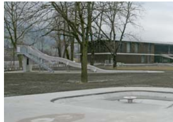
Kinderplanschbecken und Wasserrutsche