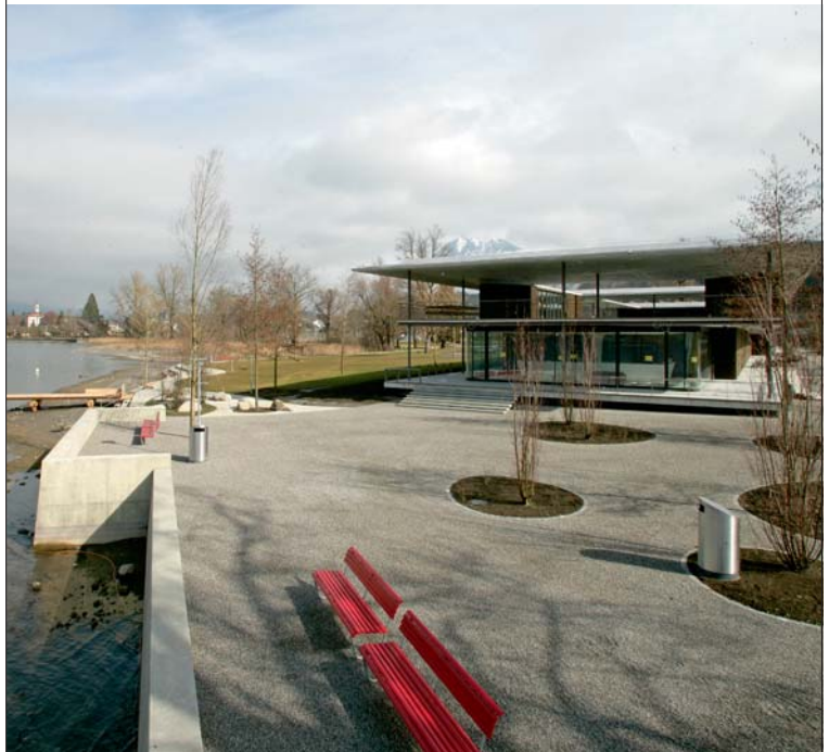
Geniessen und entspannen: Freizeitoase Seefeld Park

ebenfalls vom einmaligen Ambiente und dem Gesamtangebot des Seefeld Park profitieren. Zweifellos wird das Restaurant Seefeld nicht nur zum nahe liegenden Ausgetripp für Campingbewohner und Bade-freunde, sondern zur echten Alternative für alle Sarnerinnen und Sarner. Schliesslich sorgen auch die Campinggäste aus dem In- und Ausland hier immer für Ferienstimmung.