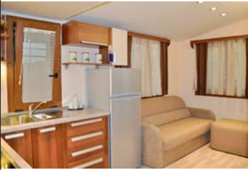
Innenansicht eines Mobile Homes