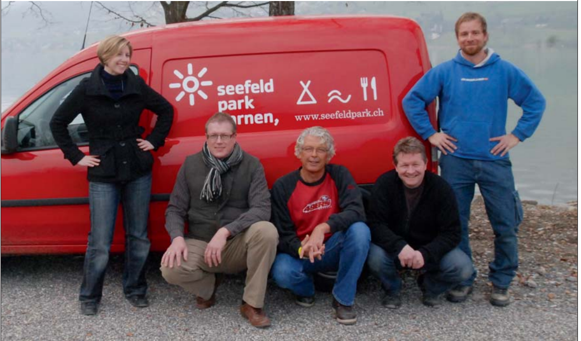
Das Leitungsteam ist bereit – und freut sich auf Sie!

verworfen oder weiterentwickelt, Degustationen durchgeführt, anstehende Arbeiten geplant, Kontakte geknüpft etc. etc.