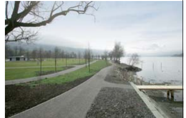
Zeltplätze direkt am See