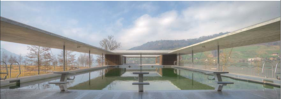
Tolle Aussichten: das Panoramabad im Obergeschoss