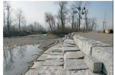
Grillplätze für alle