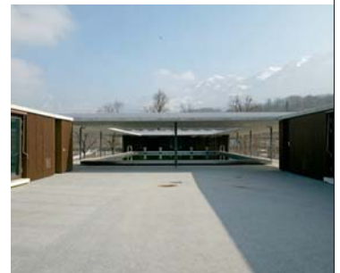
Sonnendeck im Obergeschoss