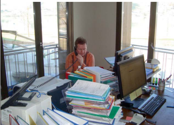
Die Arbeit stapelt sich: Es gab und gibt viel zu tun!

Im Januar dieses Jahres war es dann soweit: Das Leitungsteam wurde nach und nach vergrössert und ist seit Mitte Februar komplett. Als provisorisches Büro diente uns der zukünftige Personalraum im Hauptgebäude. Während der letzten paar Wochen wurden auf engstem Raum Kunden betreut, Pläne geschmiedet, Mietobjekte besichtigt und gekauft, viele Fragen gestellt und beantwortet, Finanzen analysiert, Personalpläne erarbeitet, Vertreter empfangen, verschiedenste Termine wahrgenommen, bauliche Massnahmen diskutiert, Telefongespräche in mehreren Sprachen geführt, die tägliche, erfreulich grosse Mailflut (Reservationen!) bewältigt, Möbel, Kleider und Geräte ausgesucht, Ideen entwickelt,