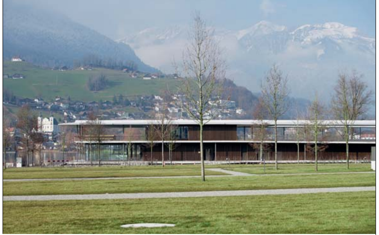
Traumkulisse: der Seefeld Park passt sich der Landschaft an