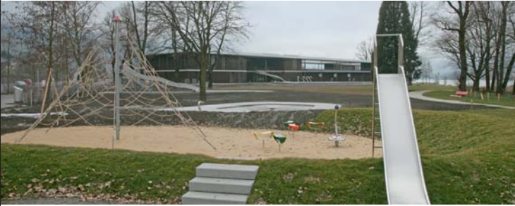
Spielplatz und Kinderplanschbecken