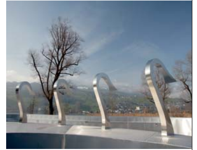
Nackenduschen im Erlebnisbecken