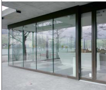
Glasfront im Restaurant Seefeld