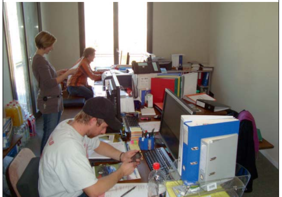
Teamwork auf engstem Raum: das provisorische Büro