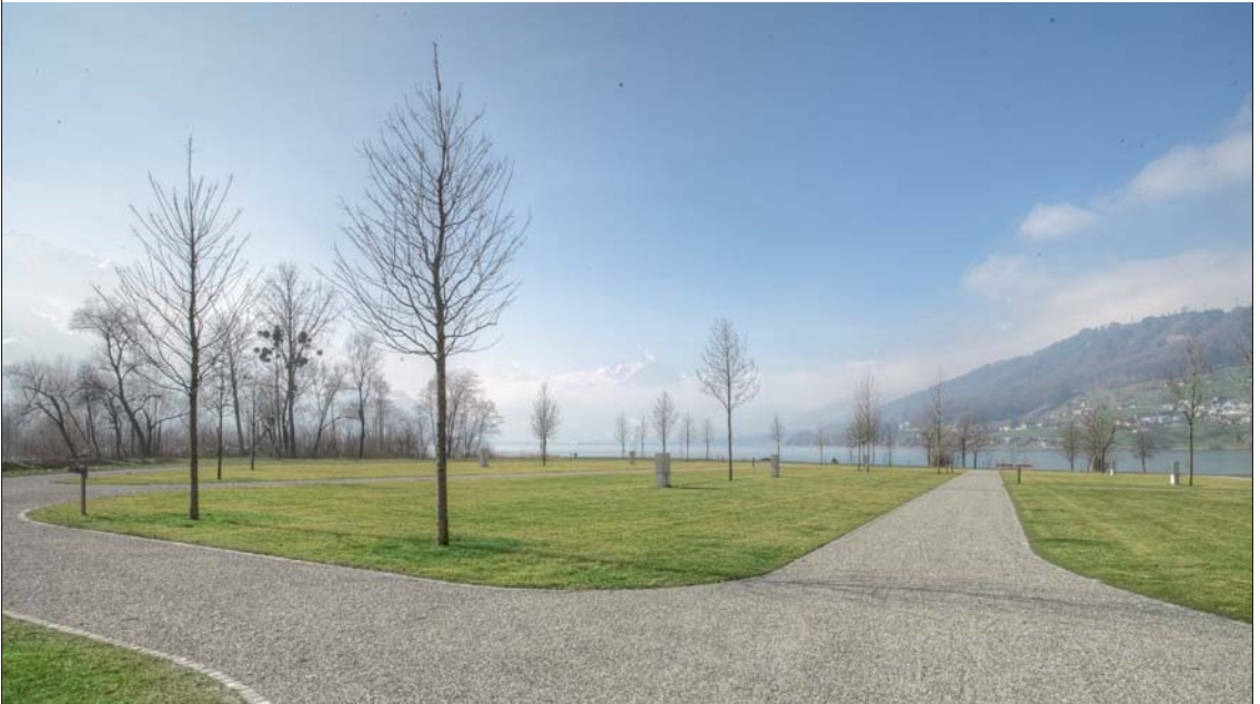
Hier werden Campingträume wahr: grosszügige Parzellen, einmalige Lage