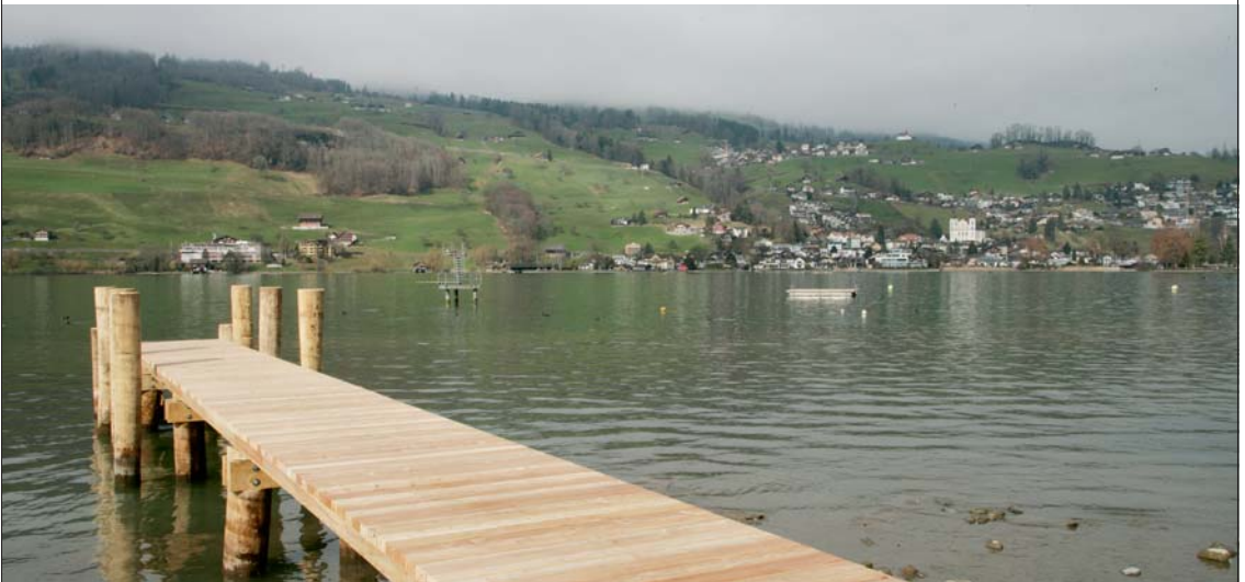
Zur Abkühlung im Sommer: Sarnersee mit Steg, Sprungturm und Floss